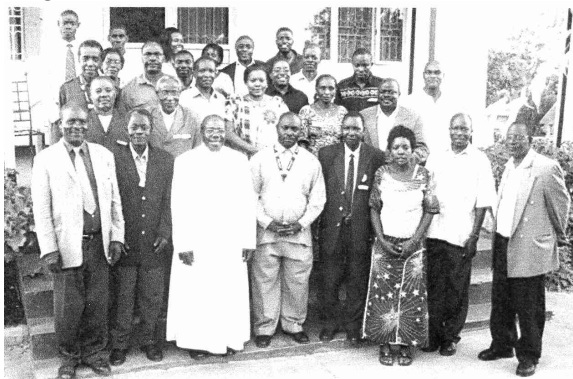
nie gegeben! (Gruppenbild mit dem Bischof von Masaka)

Die neu gewählte Diözesanleitung in Songea hat einen ihrer ersten großen Pläne verwirklicht: Die Teilnahme an einem Fortbildungsseminar in Uganda! Geschlossen reiste sie am 8. Dezember nach Masaka, um sich von der ausgezeichnet funktionierenden KAB-Bewegung in Uganda inspirieren zu lassen und sie reisten nicht allein ... Vorplanungen unserer drei Songea-Delegierten sowie der umsichtigen Vorbereitung durch George Ssozi mit Hilfe des Weltnotwerkes ist es zu verdanken, dass zeitgleich vier weitere KAB-Bewegungen in Ostafrika, dieses Seminar nutzen konnten: Unser Exco wurde von zwei Delegierten aus der Nachbardiözese Mbinga begleitet. Ebenfalls vertreten war der Norden Tansanias mit einem Vertreter der Diözese Bukoba, sowie vier Delegierte der Diözese Rulenge-Ngara. Weitere fünf Personen vertraten die Nationalbewegung in Kenya. Eine derart breite Begegnungsmöglichkeit hat es vorher noch